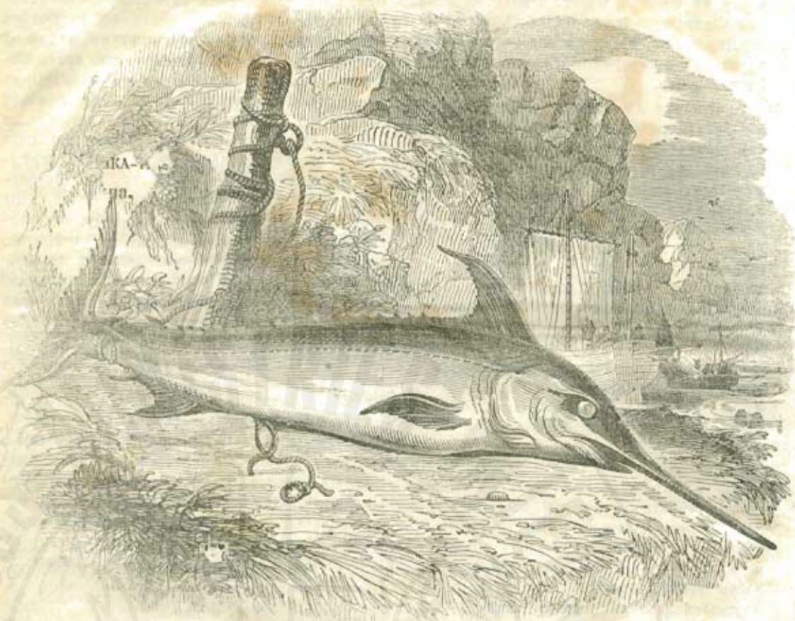
САБЛЯНКА-ТА. (Калѣжъ блажетъ.)

На тази рибѣ това име се дава защото носъ-тъ ѝ е продълженъ и прилича нѣкакъ на сабля.